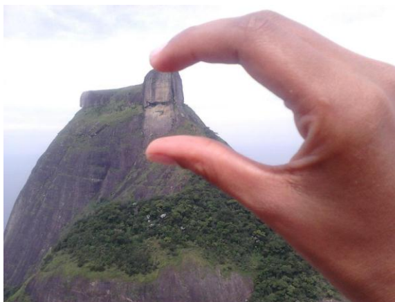
Figura 01: Exemplo de ilustração

Gráficos e Figuras deverão constar na própria folha do texto e devem vir acompanhados de uma legenda numerada seqüencialmente com algarismos arábicos. A legenda deve seguir o seguinte padrão: